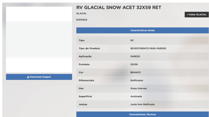
Modelo (exemplo) a ser seguido.

O revestimento final deverá ser cerâmico com placas tipo esmaltada extra de dimensões em conformidade com o orçamento. O modelo e cor deverá ser apresentado a municipalidade para aceitação, devendo manter imprescindivelmente as condições de resistência e dimensões projetadas e orçadas. Deverão ser utilizadas peças que possuam rejuntamento máximo de 2mm, e retificadas de fábrica.