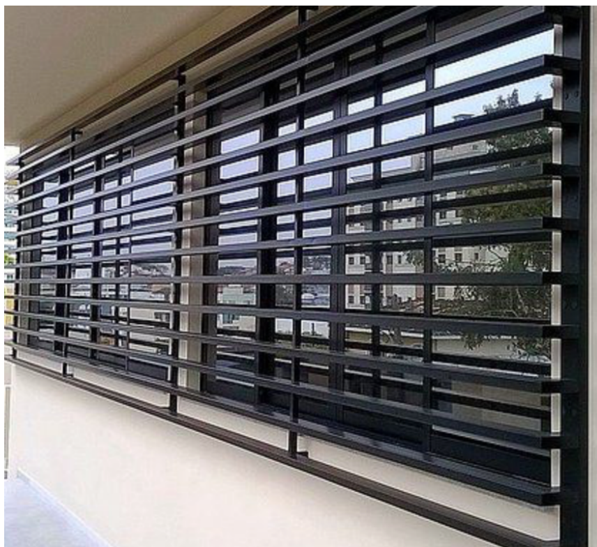
Modelo a ser seguido.

4.3. Portas: As portas previstas para serem utilizadas em obra deverão ser implantadas conforme orçamento: