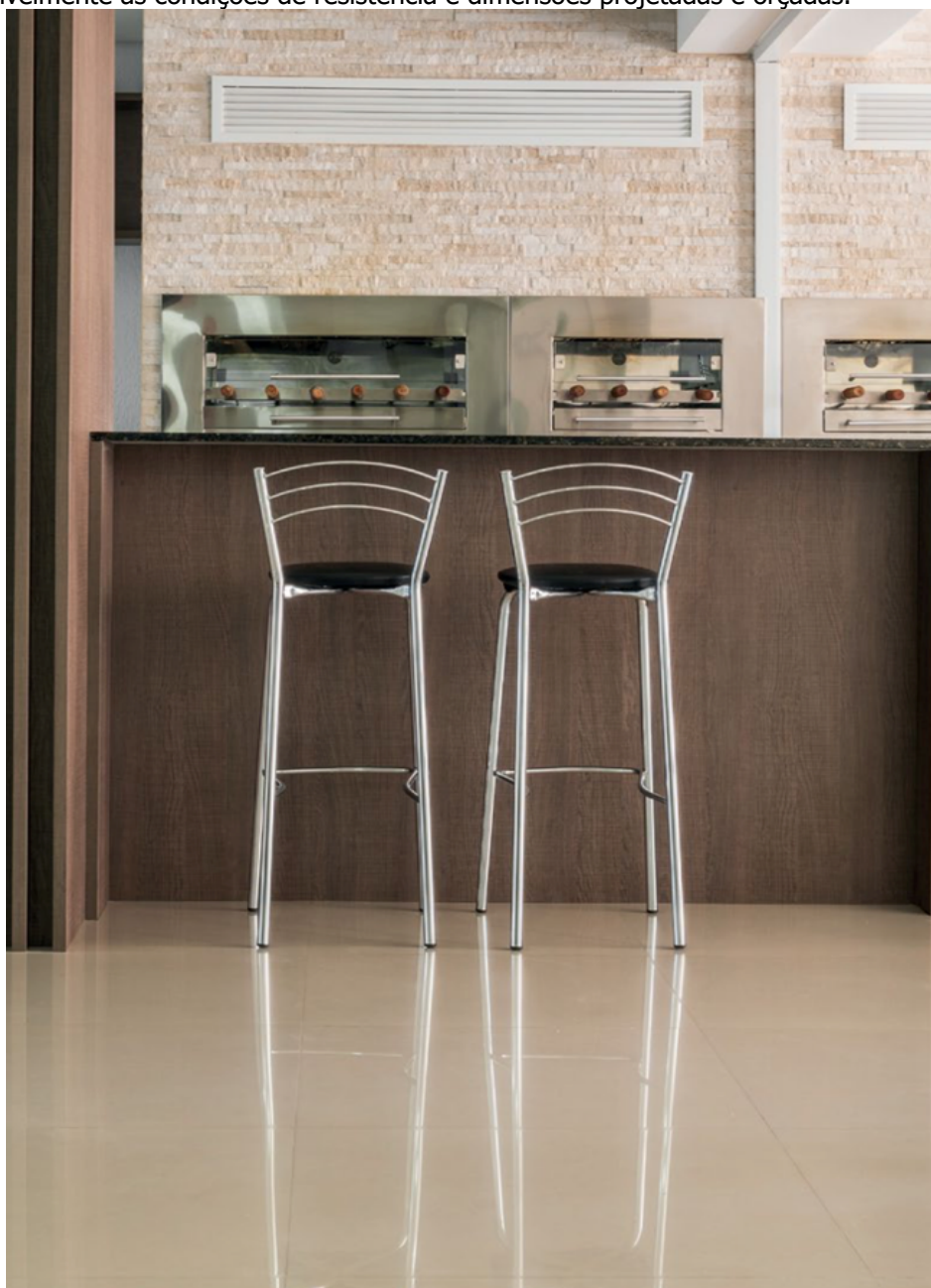
Modelo a ser seguido.

O revestimento final deverá ser conforme orçamento, mas em porcelanato em placas tipo polido de dimensões em conformidade com o orçamento. O modelo e cor deverá ser apresentado a municipalidade para aceitação, devendo manter imprescindivelmente as condições de resistência e dimensões projetadas e orçadas.