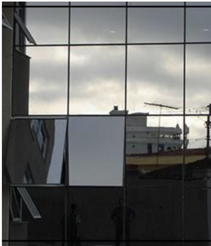
Modelo a ser seguido.