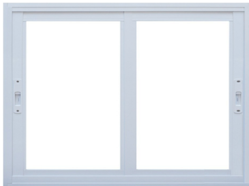
Padrão SUPREMA – Esquadrias em Alumínio