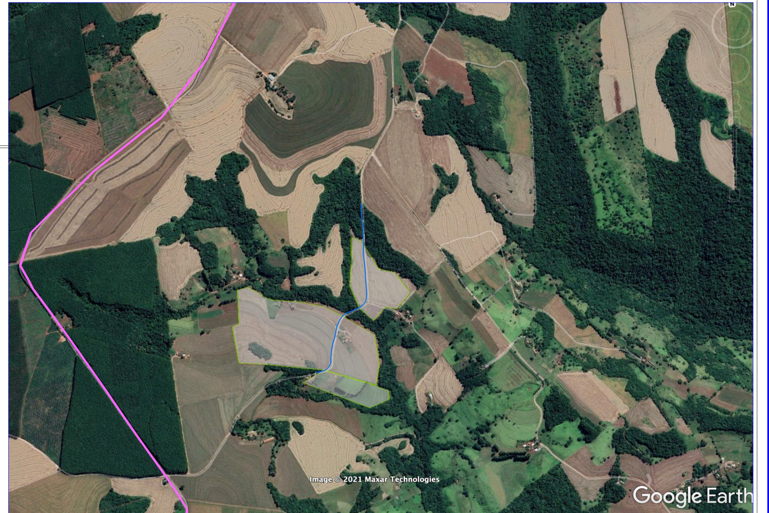
VISÃO ESQUEMÁTICA SEM ESCALA