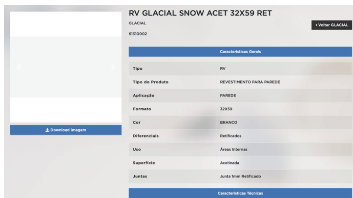
Modelo (exemplo) a ser seguido.

O revestimento final deverá ser cerâmico com placas tipo esmaltada extra de dimensões em conformidade com o orçamento. O modelo e cor deverá ser apresentado a municipalidade para aceitação, devendo manter imprescindivelmente as condições de resistência e dimensões projetadas e orçadas. Deverão ser utilizadas peças que possuam rejuntamento máximo de 2mm, e retificadas de fábrica.