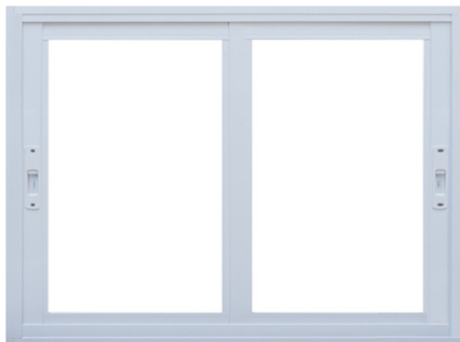
Padrão SUPREMA – Esquadrias em Alumínio