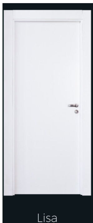
Modelo a ser seguido.