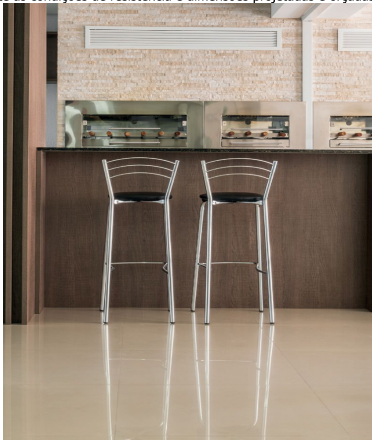
Modelo a ser seguido.

O revestimento final deverá ser conforme orçamento, mas em porcelanato em placas tipo polido de dimensões em conformidade com o orçamento. O modelo e cor deverá ser apresentado a municipalidade para aceitação, devendo manter imprescindivelmente as condições de resistência e dimensões projetadas e orçadas.