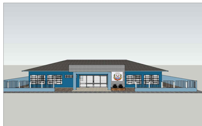
DETALHE FACHADA FRONTAL