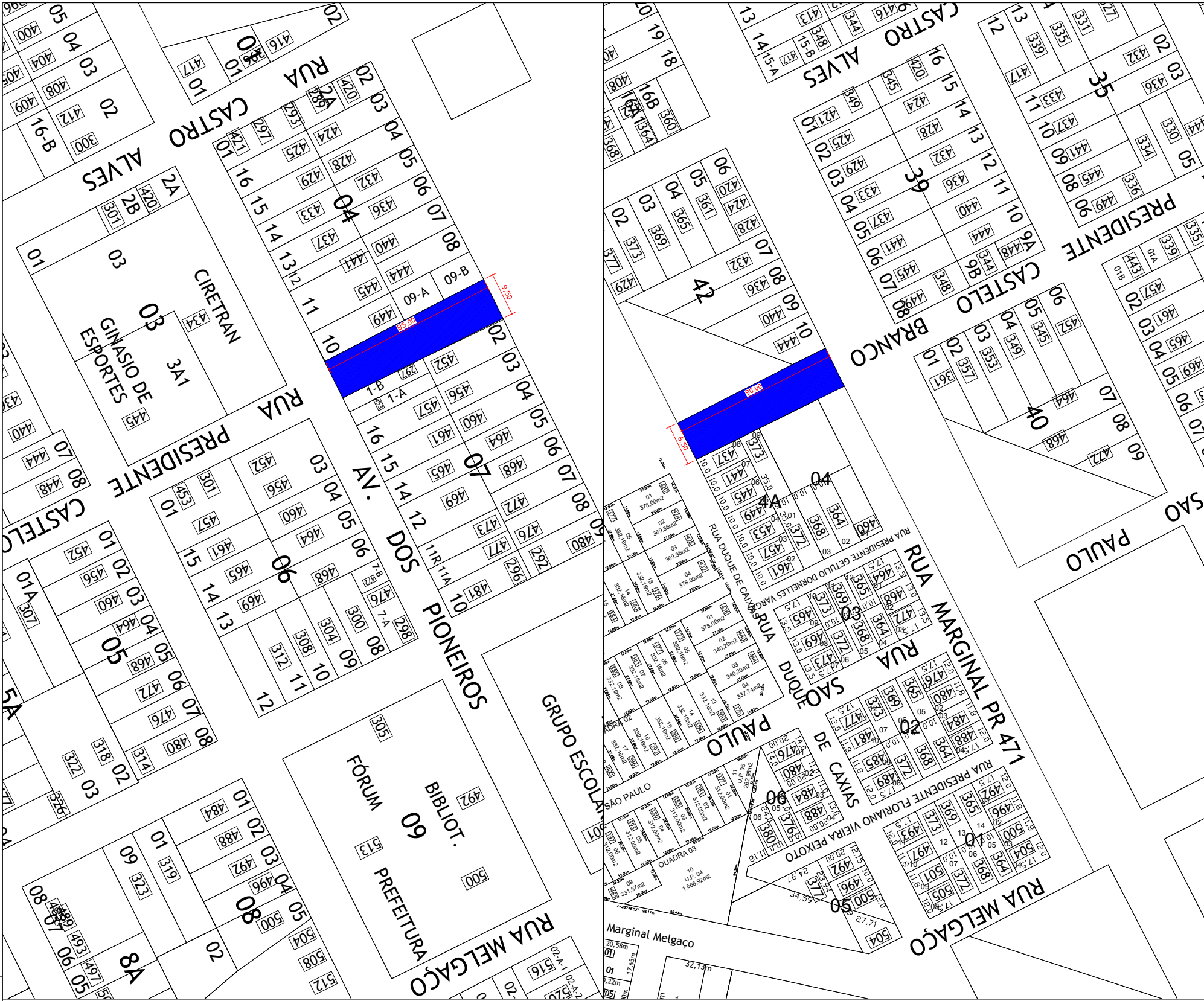
MAPA ESQUEMÁTICO - TRECHO 04 SEM ESCALA